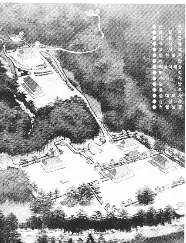
○신라구산선문의 개산도량이었던 영월 법흥사는 10만등 불사를 위한 1천일 기도를 11월에 입재하며 도량중창을 시작한다. 사진은 조감도.