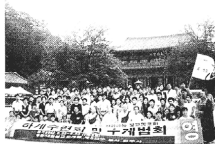
하이델불교동호회는 8월22일부터 23일까지 법주사에서 제7회 하계수련 및 수계법회를 개최했다.