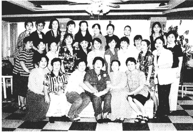
연천 향지모임이 1일 40여명의 회원이 참가한 가운데 창립식을 갖고 공식 출범했다.