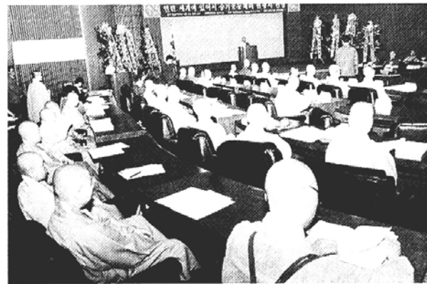
작년 3월 가산불교문화연구원 주최로 열린 '세계불교학자들의 교류와 수행체계' 국제학술회의.

동국대 신라문화연구소(소장 김갑주)는 제20회 신라문화제 행사로 10월9~10일 경주 현대호텔에서 국제학술발표회를 개최한다. '분황사