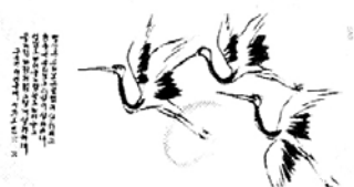
◇주일스님작 '학'. 인사동 백악예원에 전시된다.