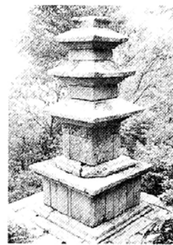
조각하여 한식지붕 형태를 갖춰 학술적 가치가 높은 탑이다.