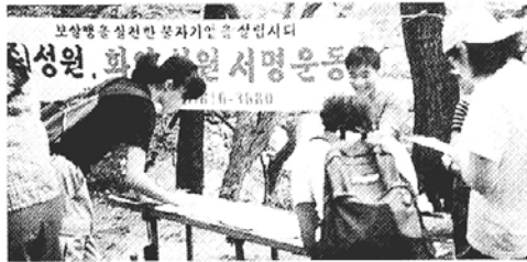
◇통도사에서 불자들이 성원살리기 서명운동에 동참하고 있다.

받아들여져 다시한번 한국경제 발전과 사회복지향상에 기여할 수 있도록 관계당국에서 청원한다"고 진행하고 "부처님의 자비보살행을 몸소 실천해온 불자기업살리기에 전국의 불자들이 나서자" 말했다.