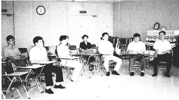
◇금융결제원 불자회 회원들이 12일 점심시간을 이용하여 회의실에서 법회를 갖고있다.