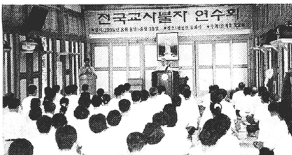
◇전국교사불자연합회 하계수련회가 8일부터 10일까지 대구 동화사에서 개최됐다.

새싹불자를 키워내는 전법자로 나선 교사불자들이 한여름 더위를 이겨내며 수행정진에 열심이다. 8일부터 10일까지 팔공산 동화