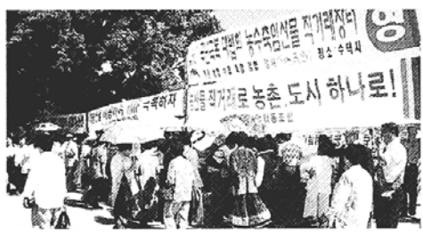
◇22일 서울 영화사에 불교기념학교 농산물 직매장이 개장된다. 상상의 우리 농산물도 구입하고 우리 농촌도 돕자. (사진은 수덕사 농산물 직매장)

■ 보조사상연구회 제16차 월례발표회=오후 2시30분 법륜사 불일문화관에서 사지(寺址)고교학의 현황과 과제에