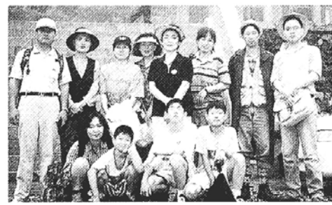
◇생명나눔회 산과 산사산행은 매일 짙어 있는 산을 찾아 신심을 쌓아가고 있다. (사진은 지난해 판악산 연주암을 찾은 회원들)

■ 천태종 무인연 하안구 결제식=오후 10시 구인사에서 실시한다. (02)233-6210 ■ 부산 불교 휴사량 자원봉사단 봉사활동=27일까지 부산불교신도회 주최로 표충사 일대 농가를 대상으로 실시한다. (051)464-2020