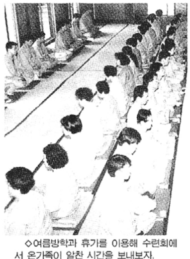
◇여름방학과 휴가를 이용해 수련회에서 온가족이 알찬 시간을 보내보자.