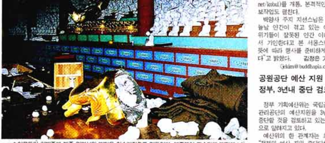
○아교도가 한밤중에 제주 원명선원 법당을 이수라장으로 만들었다. 본존불이 파손된채 법당에 나뒀고 화강암으로 조성된 천불단의 7백50여 구 불상은 목이 잘려 나갔다.

조사선(祖師禪)의 전통 계승을 통해 정신적 위기에 처한 인류에게 해결의 길을 제시하기 위한 ‘국제 무차선회(無差禪會)’가 오는 8월18~22일 고 불총림 백양사에서 개최된다. ‘무차대회’란 오랜 전통을 지닌 불교의식으로, 아무런 차별없이 평등하게 제법(法)을 설하는 법회. <관림사 3면> 이번 무차선회는 경제현황과 어려움 겪고 있는 우리 사회