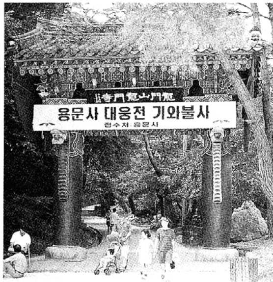
◇ 문화관광마을이 있는 양평군에는 조선 태조가 경기도 최고봉이라는 뜻으로 이름지은 용문산이 있다.