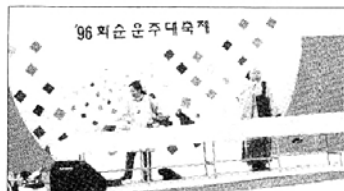
◇사찰음식연구소가 온주문화축제에서 가진 공개강좌.

한국전통사찰음식문화연구소(소장 적문)는 개원 6주년을 맞아 16일~19일까지 삼성동 한국종합전시장(KOEX) 3층 대서관에서 전통사찰음식 무료공개강좌 및 시식회를 연다.