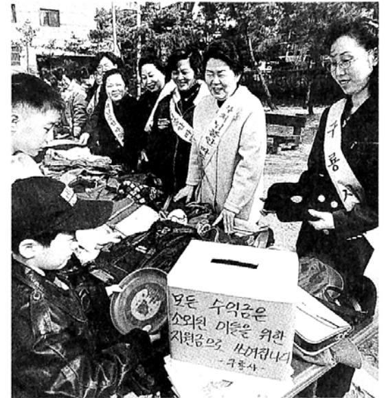
실직자 자녀 돕는 일일장터에서 이웃의 아픔을 함께 나누자. 사진은 구룡사 일일장터

경제난으로 실직자 가정이 증가하는 어려운 상황에서 고통을 분담하는 실직자 자녀들이 하루장터가 펼쳐진다