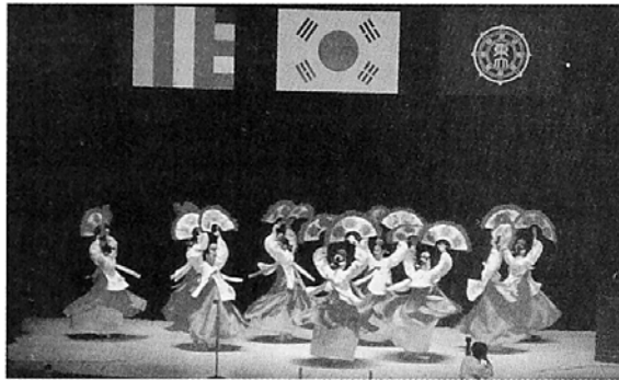
대한불교청소년스녀부문의 부채춤 공연은 장내 청소년들의 큰 호응을 얻었다.

기 구 이소령 누가 좋다 만 마음인가 산인(山人)이 퍼 올린 한 삽 구름이 흐르는 저 산은 누가 답아놓은 이름인가 산이 슬프게 깨어난 저 바다는, 무의 세계에 침범하였더니 모를 일이 천지라, 나의 출현으로 구름이 부서지니 여린 달의 내 꿈도 부서져 내리고 평과 멀어지면 하늘에 가까이 지리라 했거늘 하늘은 하늘일 뿐이로구나, 지상 보이는 세상의 크기만큼 무릎의 감옥에서 눈을 감지 않고는 답답했어라, 이제는 눈을 감고도 자유로운데... 산중(山中)의 내 집도 속세라 짐을 버렸건만 새가 나를 피해 날으니 고독하여라, 아 육탄에 걸어진 인간이 되더라도 목탁소리가 그리워 나를 이제 기구를 버린다.