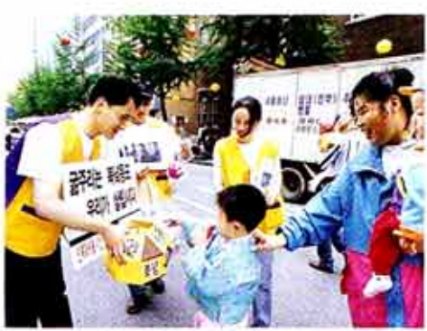
북한동포돕기 성금을 내는 고사리순.

“... 올해는 유달리 가족단위의 연등축제 참가자들이 많았다. 아이들과 부모와 함께 연등을 들고 행진하는 장면은 IMF의 괴로움에 끌어주는 효험한 볼거리였다.