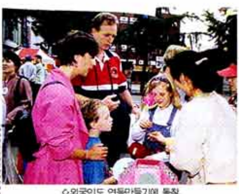
외국인도 연등만들기에 동참