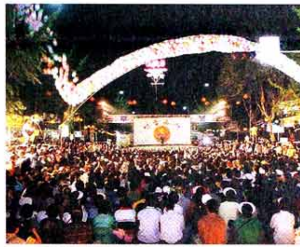
부처님오신날을 천타하는 조계사 앞 연등축제의 희망마당