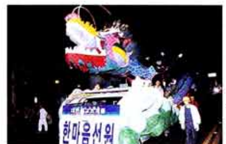
각 사찰의 장엄물들은 제등행진의 별미로 시민들의 눈길을 끌었다