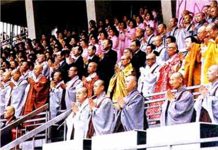
연등법회에서 자비의 실천으로 경제년 극복을 서원하는 종단·단체 지도자들.