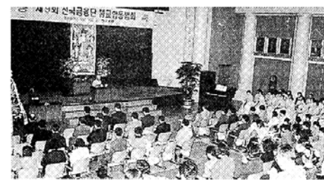
16개 금융기관이 가입한 금융단불교연합회는 연 2회 정기합동법회를 비롯하여 성지순례 행사와 수련대회, 야외법회, 기초교리강좌를 열어 수행증진과 화합을 도모하고 있다. 또 금융단불교연합회는 대사회적인 활동도 열심이다. 연 2회 연꽃마를 자원봉사 복지시설을 방문하여 불우이웃을 돕고, 자연보호 캠페인과 군부대 위문활동도 펼치고 있다.