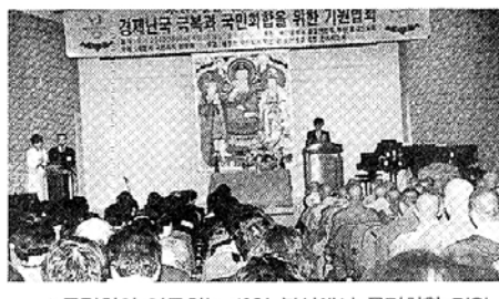
국민회의 연등회는 10일 부산에서 국민화합 기원법회를 개최했다.