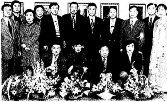
부산BBS 사진가회는 사진으로 불법을 전하고 있다. 지난 3월 방송국발전기금 마련 전시회장에 모인 회원들.