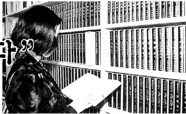
역경사업의 원활한 회항을 위해서는 정부의 중단 각 사찰과 불자들의 적극적인 협조가 필요하다. 사진은 지금까지 발간된 한글대장경.