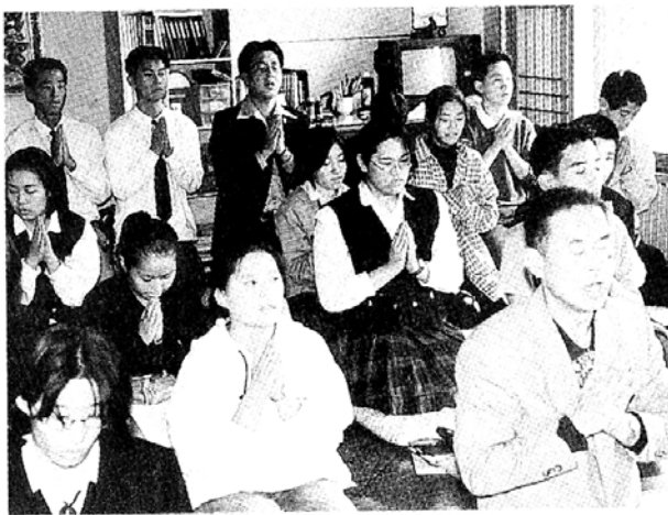
◇불교학생회의 독특한 프로그램 개발은 학생들의 관심을 유발시킨다.

고 말한다. 물론 예외도 있다. 서울석촌동 불광사, 서울갈현동 수곡사 등은 꾸준히 활발한 활동을 보이고 있다. 이들 사찰 학생회들은 제각기 풍물, 탈춤 등의 활동을 통해 자신만의 색깔을 나타내고 있다. 자