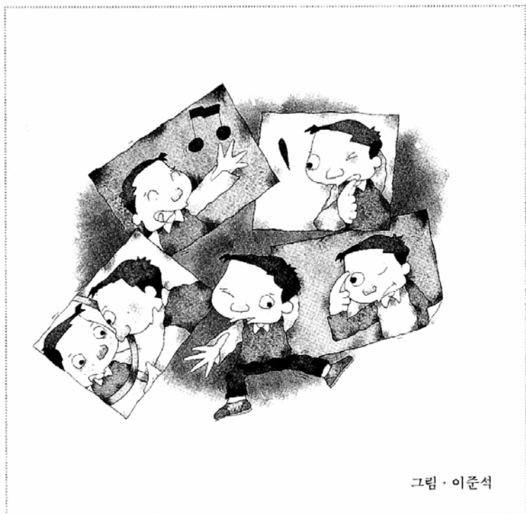
그림 · 이준석