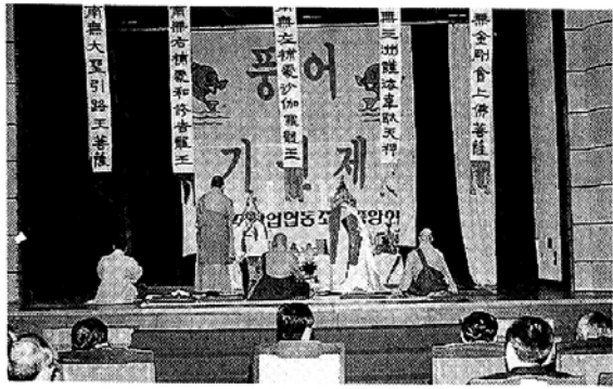
농·수협불자회가 주관하여 매년 개최하고 있는 풍어제(豐漁濟) 장면.