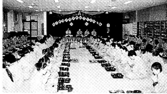
불교사회복지 종사자들은 신홍사에서 발우공양을 하며 근검절약에 힘쓸 것을 발원했다.

조계종 불교사회복지재단(이사장 원주)이 2월 20~21일 화성 신홍사(주지 성일)에서 개최한 제2회 불교사회복지시설 종사자 연수회는 참가자들의 응징정진으로 뜨거웠다. 복지관·청소년복지실 관장, 어린이집 원장 및 교사, 사회복지사 등 1백여 시설 종사자들은 1080배 정