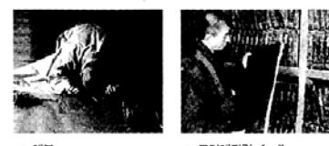
▲ 예불 개원음과 중생구제의 간절한 염원을 담은 불교의식 강연의 경의 역사적 진실과 신앙적 가치의 백미인 예불의 전 과정 최초 공개 ▲ 고려대장경 I, II 세계적인 문화유산 고려대장경의 역사적 진실과 신앙적 가치를 새롭게 조명해 낸 본격 다량엔터티 제1부 '대장경' 제2부 7백년 보존의 신비