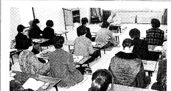
금강정사는 1인1수행법 갖기 운동으로 도심포교의 새 지평을 열고 있다.

중앙승가대측 역시 "공식적인 얘기는 없었다"며 "만약 공립사업이 추가부담을 요청할 경우 종단과 긴밀히 협조해 방점을 정할 것"이라는 입장을 밝혔다.