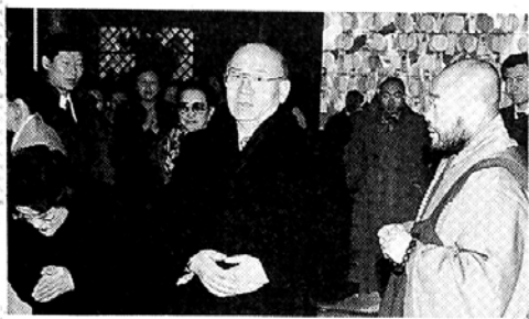
전두환 前 대통령은 수감중 '입체유심조'의 가르침을 되새겼으며 조계사에서 국대민안 백일기도를 임재했다.