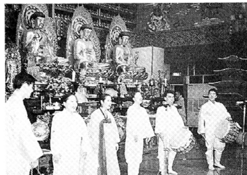
◇성도절을 맞아 전국사찰 및 사암연합회 주최 문화예술제가 잇달아 개최됐다. 사진은 지난 5일 구룡사에서 열렸던 다라니합창단의 '남도인연' 연주 모습.

자격증 대비반이 그것. 또 13일에는 취미요리반도 개강했다. 두송종합사회복지관(관장 지현스님)은 주부들의 합리적인 소비를 이끌어내면서 부업으로 활용할 수 있는 홈패션, 옷수선 등의 강좌를 내놨다. 살림승씨 아무진 아