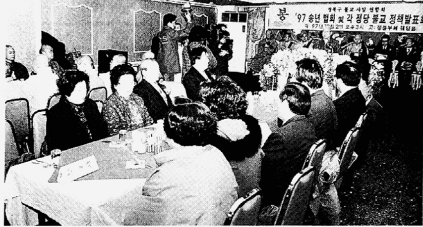
◇사암연합회는 해당지역의 정서와 문화에 밀착해 있어 지역사회의 중심 역할을 해야 한다. 사진은 서울 성북구 사암연합회 지난해 12월 대선을 앞두고 개최한 불교정책 토론회 모습.

사암연합회는 대부분 소년소녀가장 및 불우노인 후원, 교도소 위문 등 어려움에 놓인 이웃을 돕는 사업을 펼치고 있다. 지역특성에 맞춰 군법당 지원(9곳), 불교방송 지방국 건립(강원불교연