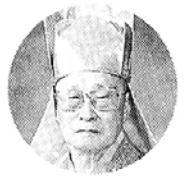
보성 (태고종 종정)

합니다. 그리고 착합니다. 그 청정하고 착한 심성이 온갖 더러움에 이끌리고 나쁜 버릇에 혼신이 되어 그 깨끗함과 선함을 잃게 되는 것입니다.