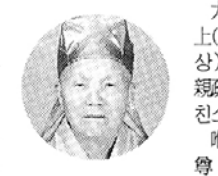
해수 (대한법회종 종정)