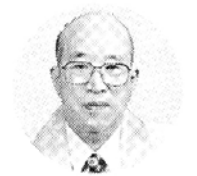
각해 (진각종 총인)

(天眞面目) 비유이요/육자진언(六字真言) 삼밀수행(三密修行)은 그 빛을 더하니/경동한 성품자리 비로법신(毘盧法身)의 정토(淨土)로다 무명이 난무하는 시대에 필요한 것은 참다운 진리이며 바른 지혜의 길로 들어서는 것은 참회와 자비로부터