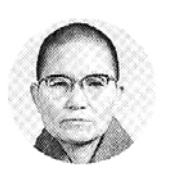
해안 (보문종 종정)