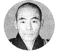
도용 (천태종 종정)

도록 힘써 하겠습니다. 부처님은 우리에게 바른 생각, 바른 말, 바른 행위, 바른 노력으로 바르게 살 것을 교시하셨습니다. 이렇게 정도와 정법으로 살아감으로써 정의로운 국가와 정의(正意)로운 국민이 되기를 바라는 바입니다.