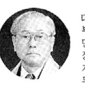
록정 (총지종 종령)