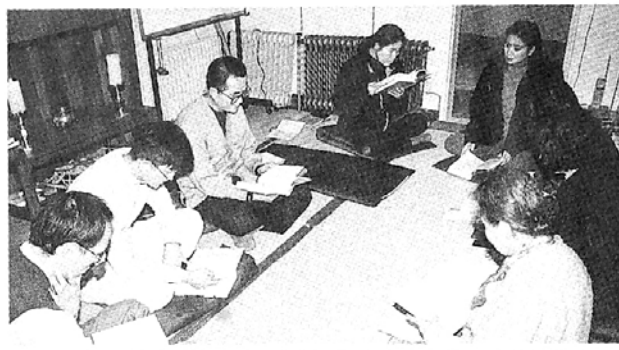
일승보살회 부회장이 신촌법당(왼쪽에서 세번째)가 신입법주들에게 <이합경>을 강의하고 있다.

모임. 8개반 2백여명의 회원이 매월 정기적으로 생활인의 불교도량인 서울 정릉법당(916-7471)과 광주 광복사(222-7801), 퇴계원 한길법당(0346-574-6160)에 각각 모여 경전공부와 참선정진으로 직장생활에서 쌓인 번뇌(스트레스)를 정화하고 있다. 정릉법당의 경우 매월 둘째 일요일