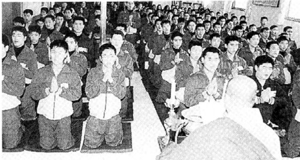
청주불교신행회 회원들은 매달 두번 청주소년원(미평중·고)을 방문, 법회도 보고 대화도 나눈다. 사진은 지난 1월 열린 수련회 및 수계법회 장면.

참선정진을 통해 보리심을 다지고, 매달 둘째 일요일 천도염불독송을 통해 회원들과 이웃의 애사(愛事)에 동참할 수 있는 능력을 키우고 있다. 때로는 열습등 장의교육도 시행해 이웃에 애착을 심어주고 있다. 평소 기도로 보살심을 키워 온 청주불교신행회가 더욱 심혈을 기울이