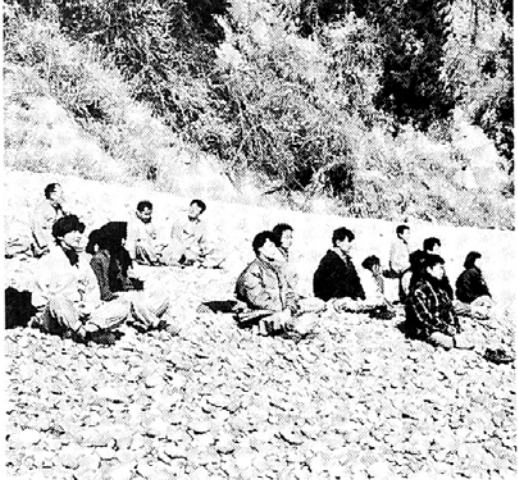
△산사의 겨울수련회에 불자들의 관심이 높고있다. 사진은 송광입 겨울수련회에서 좌선을 하고있는 동참자들.

△류진수씨 모친상=류진수 부산불교방송사장 모친 김명호(89)씨가 11월22일 속환으로 별세. (051)644-2236, 5570