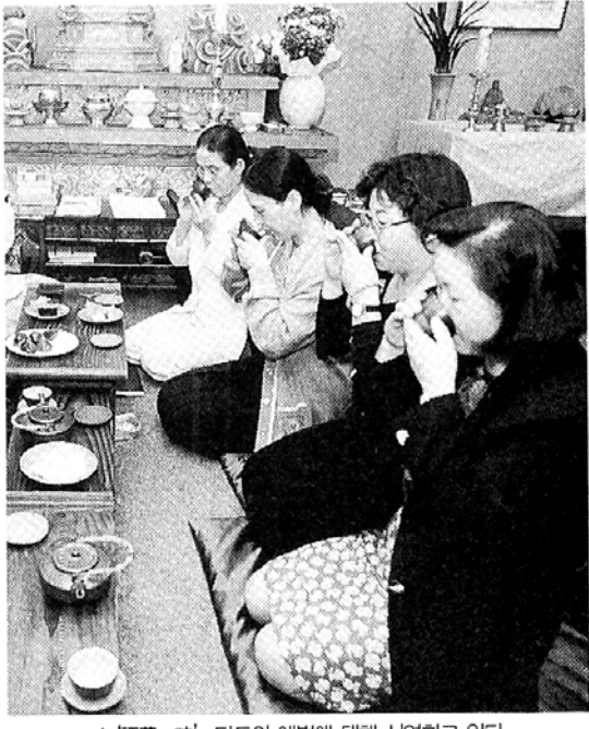
◇ '茶一味' 다도의 예법에 대해 시연하고 있다.