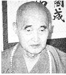
기대했다. 인덕스님 일행은 석굴암과 분황사, 통도사와 화엄사 등 우리나라 불교성지를 둘러본 뒤 귀국할 예정이다. 경주=이은호 기자

대사부터 지금까지 김교각스님 뿐”이라면서 “스님의 업적과 정신은 오늘날에도 큰 감화를 주고 있다”고 말했다. 스님은 지난해 교각스님 탄생 1천3백주년을 맞아 구화산 불교협회가 구화산에 99m 높이의 교각스님 동상을 조성키로 하고 이를 봉안할 대각선사(大覺禪寺)를 건립키로 한 사실도 소개했다. “성대한 법회를 베풀어준 불국사와 사부대중에게 감사한다”는 스님은 “동상 봉안이 두 나라 친선관계의 영광스러운 이정표가 될 것”을