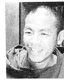
화와 한국불교에 대해서도 학생들에게 소개하고 싶다”고 포부를 밝힌 뒤 “티벳불교를 공부하고 싶어하는 한국스님들에게 도움을 주고 싶다” 말했다. 김원우 기자

에서 대승불교까지 수록하여 누구나 이해하기 쉽도록 이끌어준다. 스님은 부처님께서는 사람의 마음을 보고 가르치셨다며, 불자라면 남방불교 북방불교를 두루 배우는 것이 필요하다고 강조했다. “한국불교는 옛날의 좋은 점을 고수하기 보다는 허물어 버리는 경향이 강하다”고 지적한 스님은 “한국 스님들의 깊게 열심히 공부하는 모습이 인상 깊다”고 한국불교 생활을 평가했다. 앞으로 인도 남부 마이솔 규메데라에서 ‘만다라’를 강의할 예정인 초벌스님은 “한국문