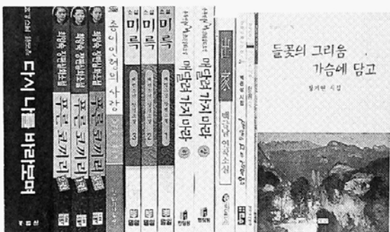
▷ 최근 발간된 불교소설과 시집들.