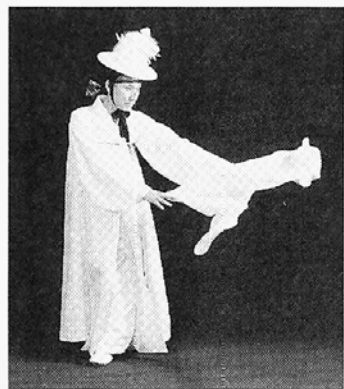
▷ 살풀이 춤을 추는 법우스님.