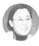
18일 오전 11시 우리는선우 법당에서 창립 6주년 기념법회 및 부처님 점안식을 봉행한다.