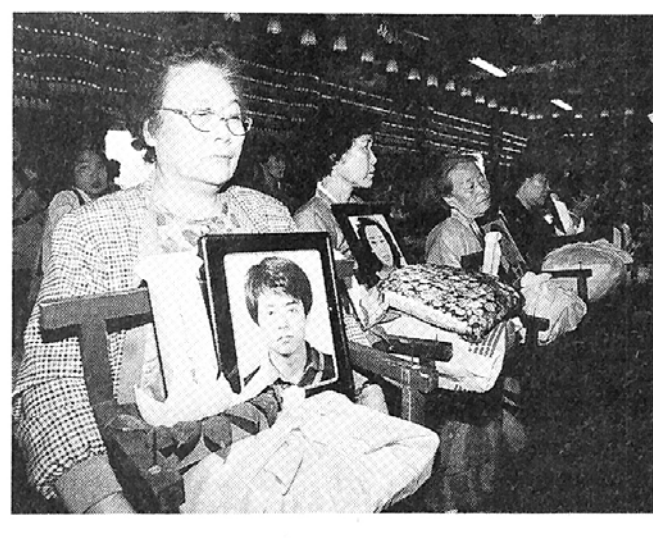
영가의 몸은 참석하지 못했지만 자성(自性)은 이자리에 참석하여 결혼을 하게 됐습니다. 이세상에서 가졌던 원망 미련 집착을 버리고 오직 부처님께 귀의하여 이승에서 못다한 명과 복을 다음세상에서 누리시기 바랍니다.

한국불교사회봉사회(회장 설산스님)가 7일 흥동 백련사 극락보전에서 개최한 KAL기 희생자 영혼결혼식 및 천도제.