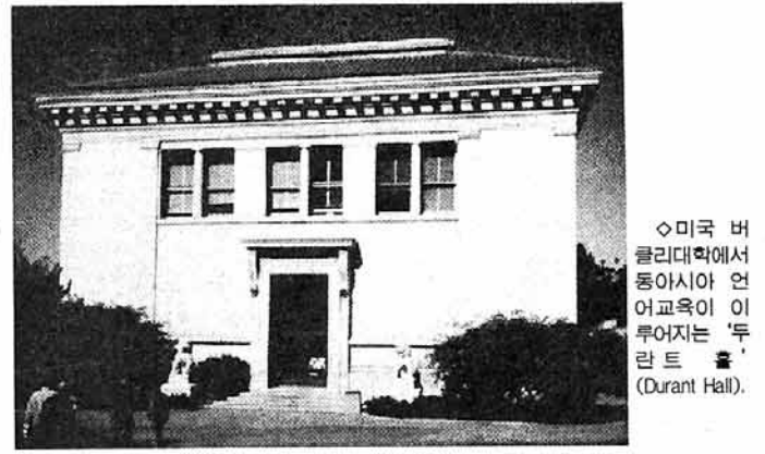
◇미국 버클리대학에서 동아시아 언어교육이 이루어지는 '두란트 홀'(Durant Hall).