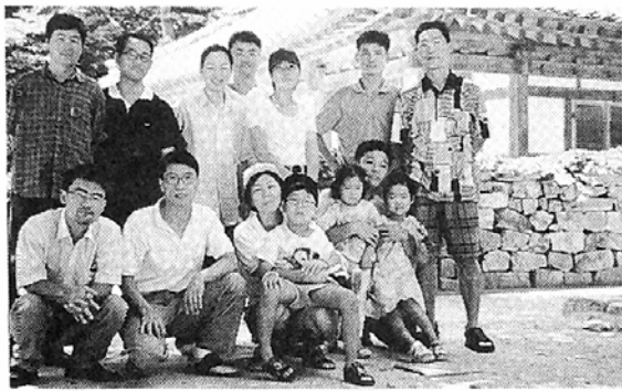
9월6일 선운사와 내소사로 사찰순례를 떠난 법우회원들.