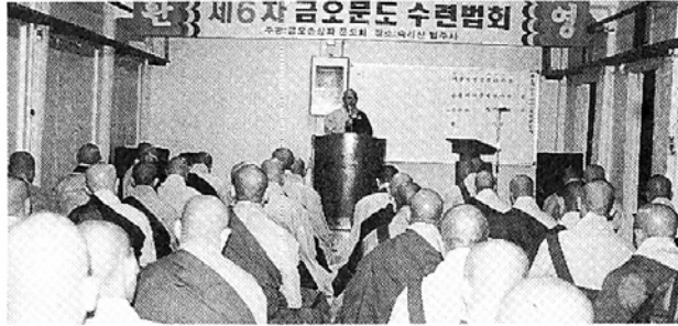
금오스님 29주기 재일에 맞춰 금오문도회 수련회가 열렸다.