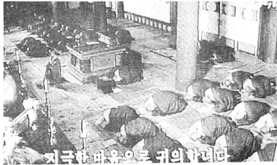
◇방영과 더불어 폭발적인 호응을 얻고 있는 불교TV '새벽예불'. 해인사 새벽 예불을 생생하게 담아낸 '새벽예불'은 불교TV의 가을개편 신설 프로그램이다.