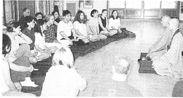
◇7일 화계사 국제선원에서 벽안의 두 스님과 영어로 법거하는 내·외국인 불자들