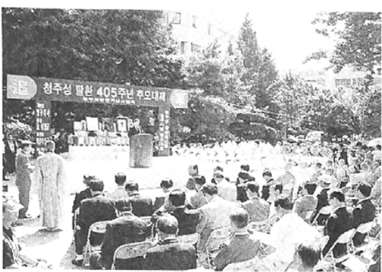
◇6일 청주 중앙공원에서 봉행된 '청주성찰한 405주년 추모대제'