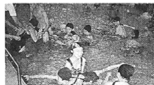
30명의 장애인이 참여한 이날 행사에 60명의 자원봉사자들이 도움을 주었다.

(사)대한불교청교련교화연합회(회장 현성)는 7일 꿈두리체육센터에서 '장애인과 함께하는 수영교실'을 개최했다. (사진)