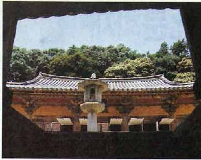
◇안양루 밑에서 바라본 석동(국보17호)과 무량수전(국보18호).