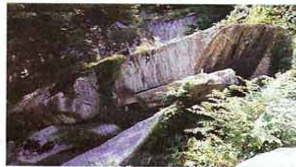
◇부석사를 창건할 때 선유가 바위로 변해 시정집배를 물리쳤다는 전설이 담긴 부석(浮石).