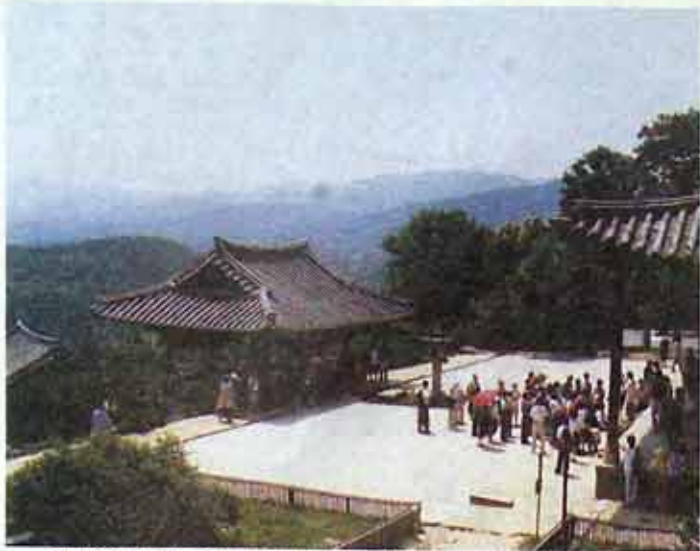
◇개달음에 이르는 길을 상징하는 부석사 가람배치는 소백산 능선과도 조화의 극치를 이룬다.