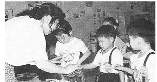
보명사유치원 북한어린이들기 바자회 열어. 사진은 시장놀이(알뜰바자회)를 개최한 모습.