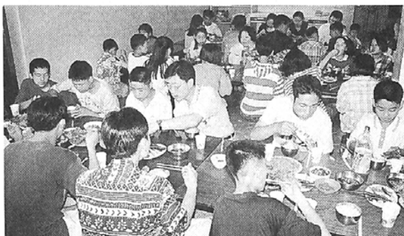
유니텔불교동호회는 매달 셋째주 일요일 보육원 승암동산을 방문해 원생들과 정겨운 하루를 보낸다. 사진은 6월15일 원생들과 함께 한 '불고기파티' 장면.

씨의 원력으로 지난 4월13일 구성된 봉사모임은 매달 사회복지 시설을 방문, 회원 각자의 특기를 살려 자장면·탕수육 제공, 가전제품·컴퓨터·가구 수리 등을 해오고 있다.