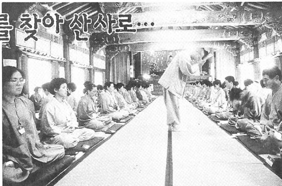
△산사의 여름수련대회는 일상에 찌든 현대인들에게 청량제 역할을 톡톡히 하고 있다.

다. 신청하기 전에는 연령별 성별 직업 등으로 세분화해 진행하고 있는 주관 사찰의 수련대회 프로그램 성격을 미리 파악해 두는 것이 바람직하다. 또한 수련생활 정도가 자신의 수행수준과 맞는지 수련경험을 고려해 선택하는 것이 좋다. 지난해 6백명 모집에 1천5백명이 몰려 신청자 반수이상을 탈락시켰던 송광사는 올해도 규율의 엄격함