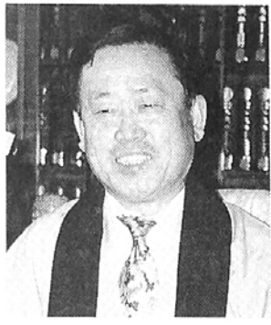
제도 개선과 자문위원회 신설을 통한 다양한 의견 수렴 등 내부 사기진작에도 심혈을 기울인다는 각오다.

“대중에 우리 종단을 알리고 이해시키기” 위해 밀교사건 간행 및 창종 50주년 기념 학술세미나 등의 각종 사업을 전개하고 사회복지법인 설립을 단계적으로 추진해 종교의 대 사회적 역할도 강화할 것입니다. “달려있다”는 세간의 이미지를 불식시키고 대중에게로 적극 다가갔다는 의지를 천명한 성초대정사 통리원장은 종무행정 전산화·정보화 등 제도 개선과 자문위원회 신설을 통한 다양한 의견 수렴 등 내부 사기진작에도 심혈을 기울인다는 각오다.