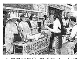
자연휴양림 조성 석굴암주변 오염 ‘불보듯’

경주 토함산 자락 37만평의 부지에 자연휴양림이 조성돼 5월말 개장을 앞둔 가운데 환경훼손에 대한 우려가 제기되고 있다. 경주시는 15억6백만원을 들여 지난 91년부터 경주시 양북면 장항리 일대 시유림에 자연휴양림을 조성해 왔다. 청소년 야영 및 가족단위 휴식지로 조성된 휴양림에는 37평형 1동과 5평형 2동 등 모두 10여개 동의 통나무산막과 계곡을 막아 만든 물놀이장 2곳이 들어서