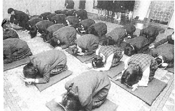
◇광동여고는 108배를 통한 감성리듬을 갖게하는 교육프로그램을 실시하고 있다.