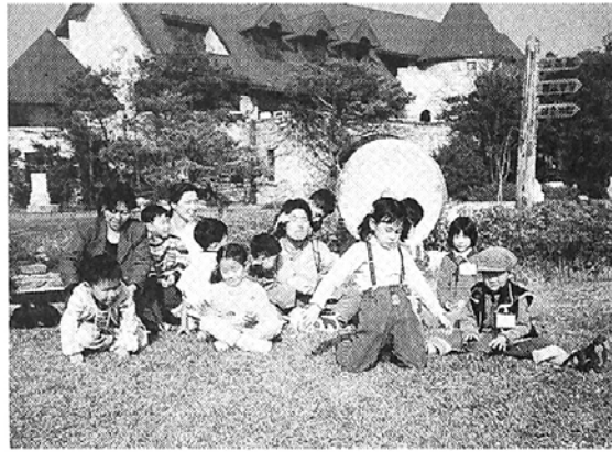
◇ 불교테마 전시코너를 마련하고 있는 전국의 이색박물관은 사찰 학습법회 및 초·중·고등학교 학습용 코스로도 환영받을 것으로 보인다.

기)은 생활사 중심의 전시물로 꾸며져 있어 각 시대별 상황에 대한 이해를 돕는다. 특히 백제 장립사지, 신라 감은사지, 고려 무량수전 등을 축소 복원하고, 애니메이션과 모형, 매직비전 등 특수장치를 통해 재미와 친근감을 더하고 있다. 또 5월14일 오후 2시30분 민속관 놀이마당에서 승무 살풀이 바라춤 북춤 등의 봉축공연을 기획, 불자가족들을 초대한다. 개관시간 9:30~23:00, 관람료 어른 4천원 어린이 2천원. 성보문화제가 다수 소장전시되