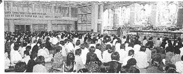
능인선원 새벽예불에는 매일 2천여명의 불자들이 참석한다.