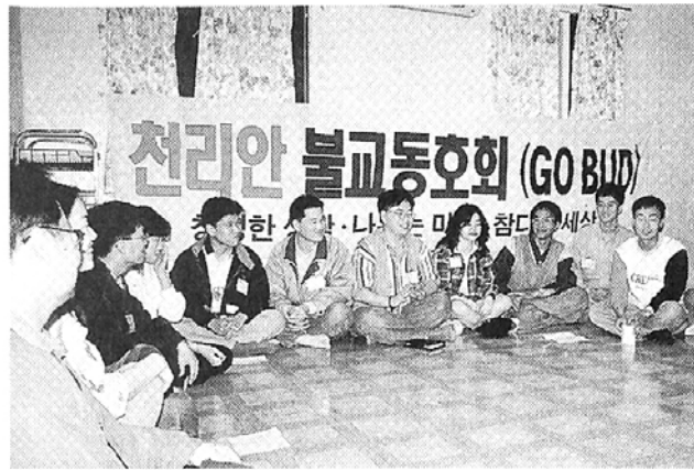
천리안 불교동호회(GO BUDD)는 19,20일 대전 동화사 부근 명산산장에서 전국모임을 갖고 스님전용 대화방인 '지대방', 문화관련 게시판인 '예인의 향', '교계소식' 등을 신설하는 매뉴얼을 확정했다.