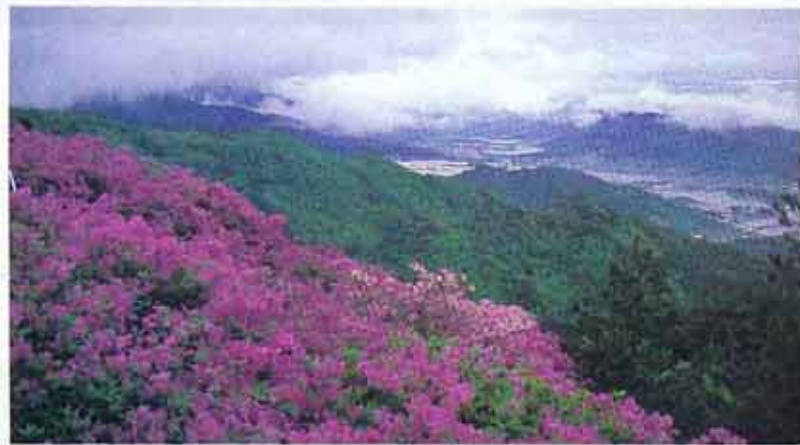
○4월부터 5월말까지 만개하는 지리산 철쭉.

탐사 풍긋 세운 말의 두 귀처럼 덩치 큰 바위가 기이한 전복 집안 마이산. 이산묘부터 돌을 쌓아 탐곡을 이룬 탐사까지 3km가 벚꽃으로 온누리하게 물든다. 19일 오전