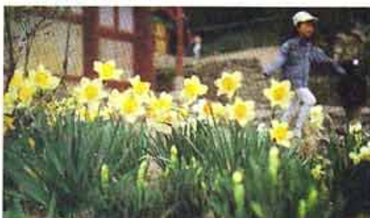
○선운사 대웅전 앞에 피어있는 수선화.

실상사 전북 남원시 운봉면 앞대에는 백장암과 약사암 등의 문화재를 포함해 단일 사찰로는 가장 많은 문화재를 가진 실상사가 있다. 백장암에서 남원시쪽으로 위치한 바래봉은