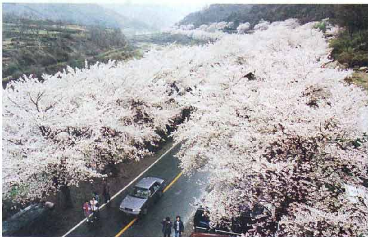
○하동 생계사 가는 길 10리길 민개한 벚꽃으로 꽃타날을 이루고 있다.

.../삼각산에 봄 벚꽃이 울러나/꽃이 피었다// 그것도 관음하심 비구니/손끝에 향내 묻어 피어 난/붉은꽃 노란꽃 연분홍도 빼질새라/꼭계급계 단장하고 피었어라//이 길로 이 길로 가노라만/ 열두 고개 스무고개 백팔고개 넘어/꽃이 피고 꽃이 피고/삼각산만이 아니라/한반도 건너 사 바세계가/불국화 이루겠네//