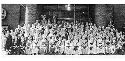
중앙승가대 제15회 졸업식

동국대(총장 송석규)는 지난 2월 25일 교내 중앙당에서 이사장 박원스님을 비롯한 내외인사 1만여명이 참석한 가운데 96학년도 학위수여식을 개최했다. 이날 학위수여식에서 송석규