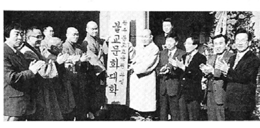
광주불교교육원 문화대학 현판식

중앙승가대학교(총장 지하)는 지난 2월 24일 정진관에서 석주 원주 설정 종하스님을 비롯 서문각 대한불교진흥원 주영 등 행원문화재단이사장 등 사부대중 2천여명이 참석한 가운데