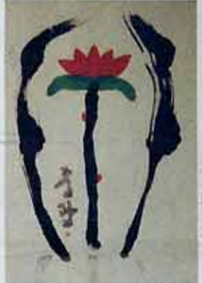
◇중권스님 작 '연꽃'