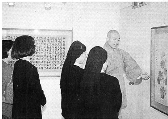
◇올해 불교미술단체들은 대부분 특정한 주제의 '테마전'을 준비하고 있어 눈길을 끌고있다.