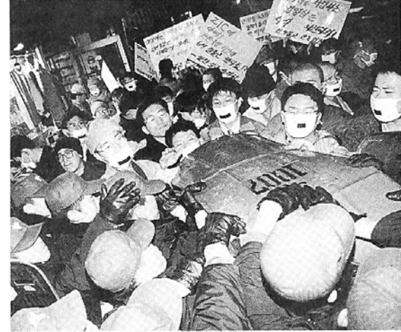
13개 연합단체가 참여한 반민주악법 저지를 위한 불교시국법회에서 지지하는 경찰과 30여분 몸싸움이 있었다.

골공민까지 침묵행진을 시도, 공권력과 30여분에 걸친 몸싸움을 벌였다. 또 불교비상시국회의는 지난 10일, 11일 노동법 및 안기부법 개악 철폐를 위한 범국민시명운동, 범국민대회를 증각사거리와 탑골공원에서 전개하고, 13일 조계사에서 민주수호를 위한 제2차 시국법회를 병행했다. 불교 원불교 개신교 천주교 천도교 등 5개 종교인들로 구성된 전북종교인협의회(불교계대표 지원)도 지난 13일 전주 전북불교회에서 노동법 및 안기부법 개악 철폐를 위한 시국기도회를 병행했다.