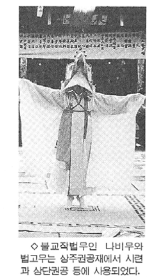
◇불교작법무인 나비무의 법고무는 상주권공제에서 시련과 상단권공 등에 사용되었다.

시상식은 내년 1월 15일 오후 2시 조계종 청사 1층 불교회관에서 거행되며 작품들은 단행본으로 출간된다. 대부분의 응모자들의 수준이 높아 불교문화의 활성화를 가능할 수 있었다. 불교적 세계인식의 문화적 형상화의 완성도가 전반적인 심사기준이었다. 일부 투고작품들의 경향은 불교에 관한 지식 나열, 불교에 대한 피상적 이해에 의존 또는 교훈적 설교 노출, 악이 선으로 전환하는 음모작들의 왜곡이나 번질 등의 4가지 형태로 유형화될 수 있는데 무엇보다도 문화의 형식과 종교적 내용이 탁월한 조화를 이루어야 한다. 불교문화도 기본적으로는 문학작품으로서의 형상성을 갖추고난 후의 일이라는 것을 염두에 두어야 한다는 것이 17명 심사위원들의 공통된 의견이다.