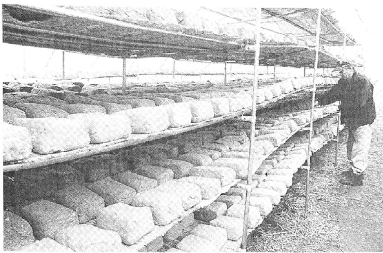
전통방식 그대로 제작되는 사찰 메주는 맛으로 정평이 나왔다.