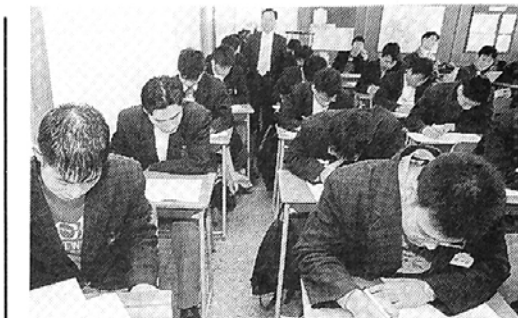
동대부속고등학교 2학년 학생들은 지난 21일 대만 불광산사 주최로 실시된 세계불교교사를 치렀다.